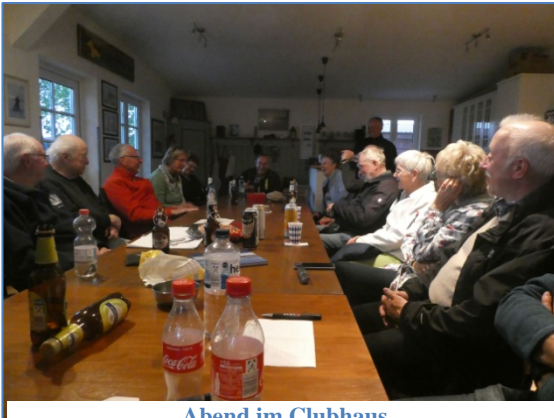
Abend im Clubhaus

Für den Abend hatte der Segelclub uns den Schlüssel für ihren Clubraum gegeben und so hatten wir dort einen lustigen Abend, zu dem jeder Getränke und Knabberkram mitgebracht hatte.