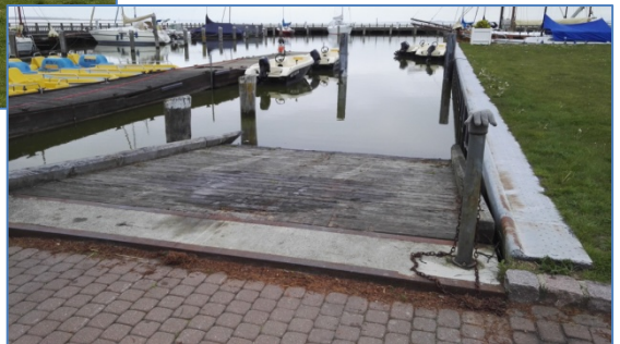
Slipsteg in Dierhagen

Nach dem Aufriggen konnten wir diese 5 Boote ins Wasser bringen, Mopsie, Hatschi, Godewind, Stephans Boot und Shaggy.