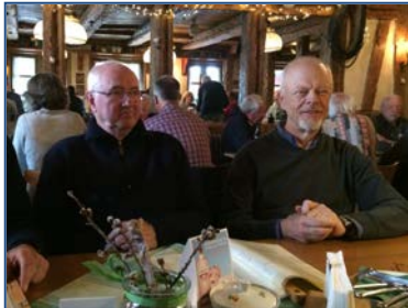
im Kehr wieder

Nach dem Mittagessen im Womo radelte ich über den Weiler Barnstorf, Niehagen und Althagen am Bodden entlang nach Ahrenshoop. Dort besuchte ich die Fischerkirche und fuhr zum Club zurück.