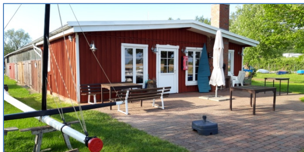
Clubhaus des FSC Godewind

Es ist der Westlichste der Bodden zwischen Althagen und Wustrow im Norden und Ribnitz-Damgarten im Süden, angrenzend an die Halbinsel Fischland-Darß im Westen. Im Osten wird der Saaler Bodden durch die „Bülten“ begrenzt, zwischen denen eine gewundene Fahrinne an Born vorbei in den Koppelstrom und den Bodstedter Bodden führt und nach Öffnung der Meiningenbrücke über den