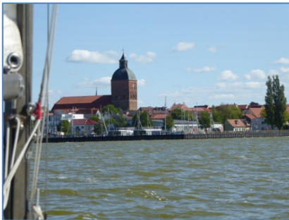
Kirche von Ribnitz Damgarten